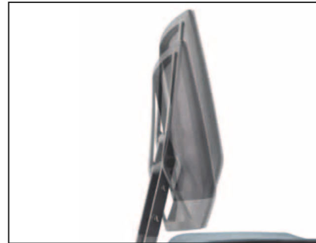
Rückenlehnenhöhe / Backrest height / Hauteur du dossier / Hoogteverstelling rugleuning