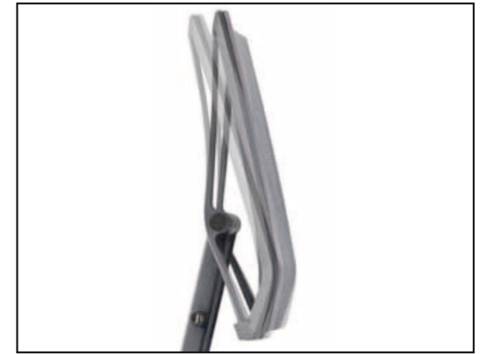
Flexible Rückenlehne mit Arretierung der Neigung / Flexible backrest with backrest tilt / Dossier flexible avec effet anti-retour / Flexibele rugleuning met blokkering