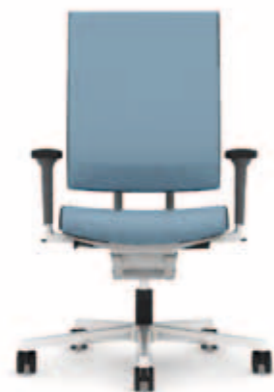
300.1000 + al301