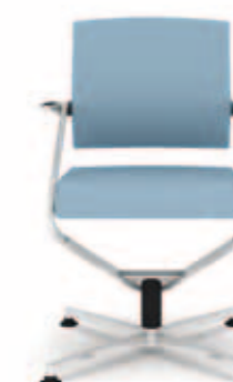
300.2000 + al310