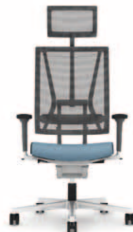
300.5000 + al301 + ns300 + ls300