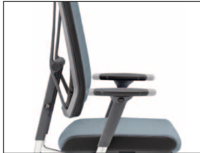
Armlehntiefe / Armrest depth / Profondeur des manchettes d'accoudoirs / Diepteverstelling armleuning