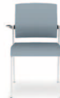
310.1000 + al310