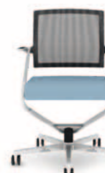
300.7000 + al310