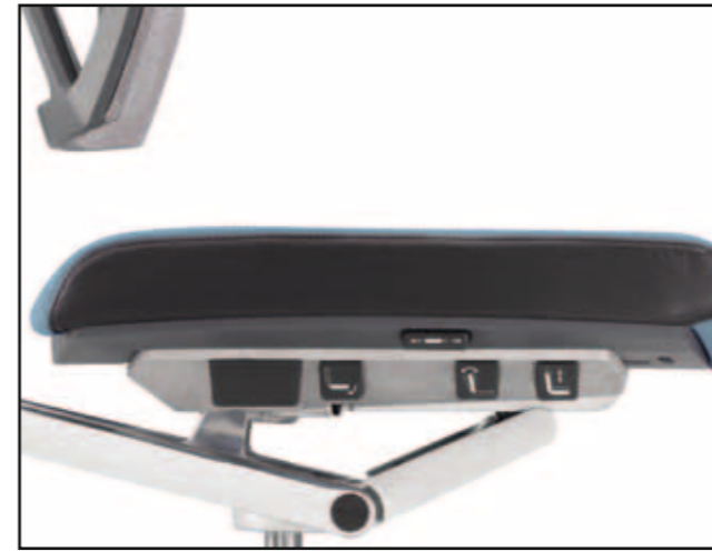
Übersichtliche Bedienelemente / Well arranged user controls / Fonctions faciles d'accès et rapidement repérables / Overzichtelijke bedieningselementen

Task chair with integrated functions / Siège de travail avec fonctions intégrées / Bureaustoel met geïntegreerde functies