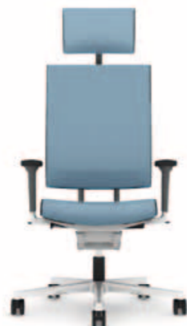
300.1000 + al301 + ns301