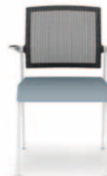
310.1500 + al310