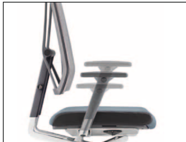
Armlehnenhöhe / Armrest height / Hauteur des accoudoirs / Hoogteverstelling armleuning