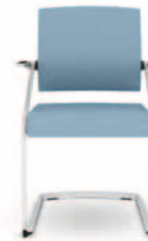
310.2000 + al310