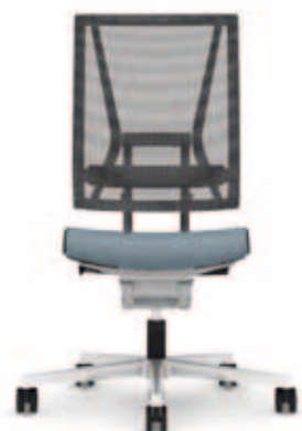
300.5000 + ls300