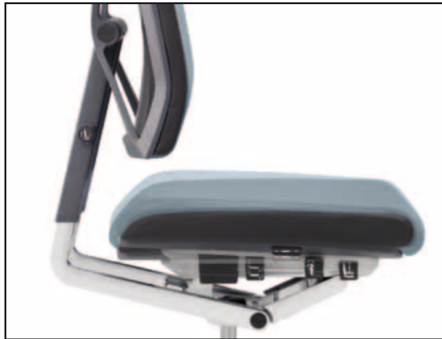
Sitzneigung, -höhe, -tiefe / Seat tilt, height, depth / Inclinaison, hauteur, profondeur de l'assise / Zit-neigverstelling