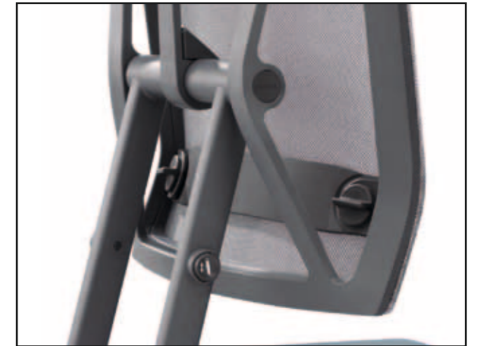
Lordosenverstellung / Lumbar adjustment / Ajustement du soutien lombaire / Lumbaalverstelling