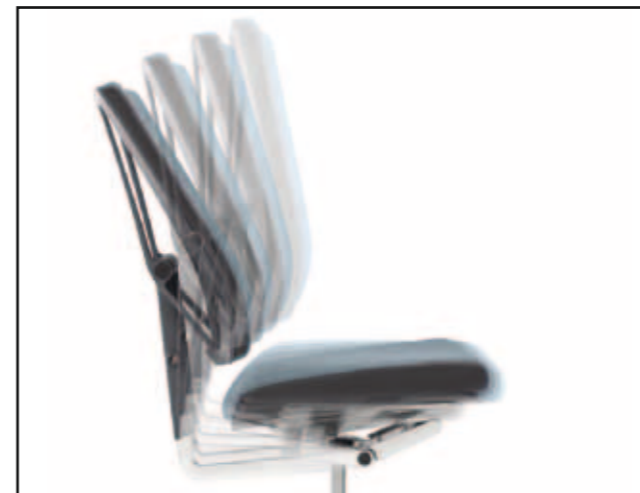
Synchronmechanik / Synchronous mechanics / Mécanisme synchrone / Synchroonmechaniek