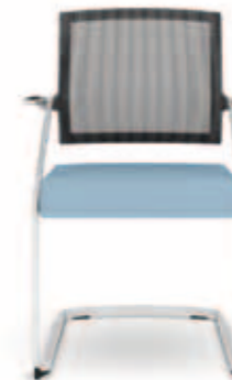
310.2500 + al310