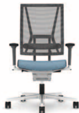
300.5000 + al301 + ls300