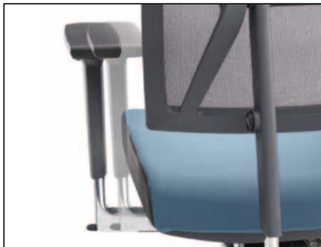
Armlehnenbreite / Armrest width / Largeur des accoudoirs / Breedteverstelling armleuning