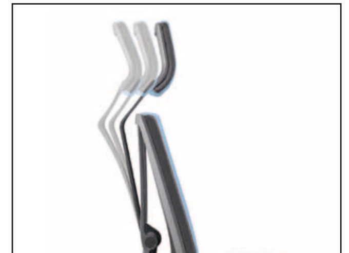
Flexible Kopfstütze / Flexible headrest / Tête flexible / Flexibel hoofdsteen