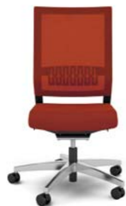
414.0000 + ls405