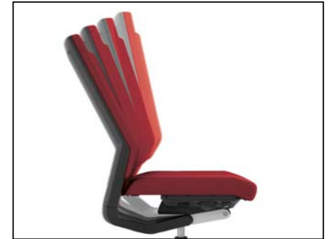
Arretierung der Rückenlehnung / Backrest tilt / Inclinaison du dossier / Blokkering rugneiging