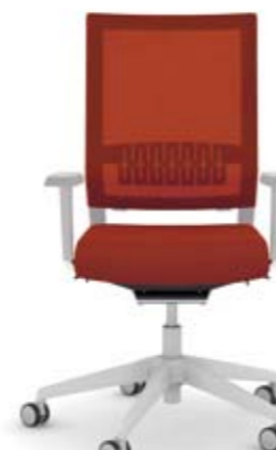
+ ls405-2 + al003