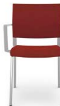
406.0100 + al421