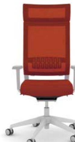
+ ls405-2 + al003 + ns410-35