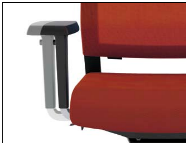
Armlehnenbreite / Armrest width / Largeur des accoudoirs / Breedteverstelling armléuning