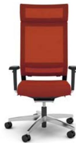
+ ls407 + al048 + ns410-16