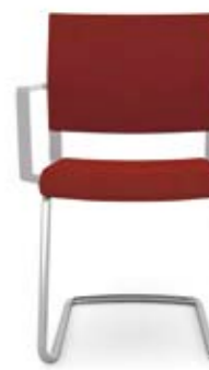
407.0100 + al421