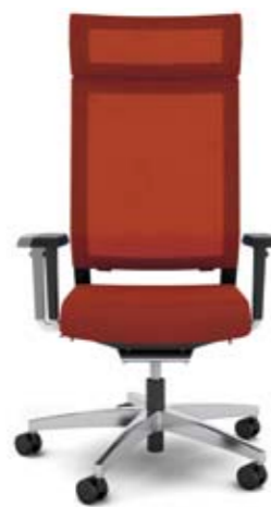
+ al048 + ns410-16