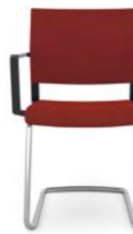
407.0000 + al420