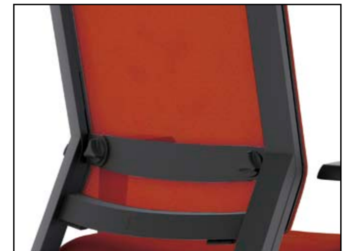
Lordosenverstellung / Lumbar adjustment / Ajustement du soutien lombaire / Lumbaalverstelling