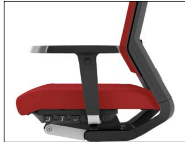
Armlehntiefe / Armrest depth / Profondeur des manchettes d'accoudoirs / Diepteverstelling armléuning