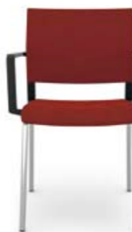
406.0000 + al420