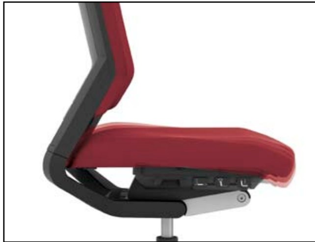
Sitzneigung / Seat tilt / Inclinaison d'assise / Zit-neigverstelling