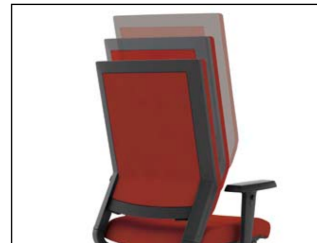
Rückenlehnénhöhe / Backrest height / Hauteur du dossier / Hoogteverstelling rugleuning