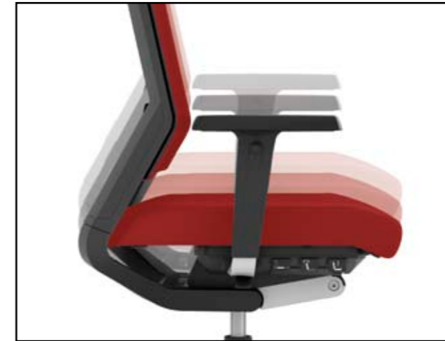
Sitzhöhe / Seat height / Hauteur d'assise / Zithoogteverstelling