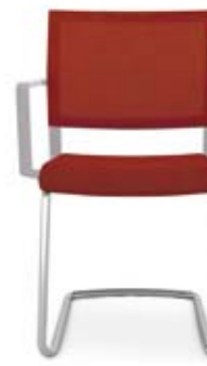
407.5100 + al421