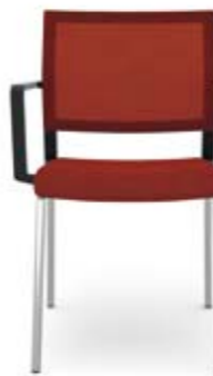
406.5000 + al420