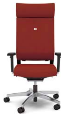
+ al048 + ns401