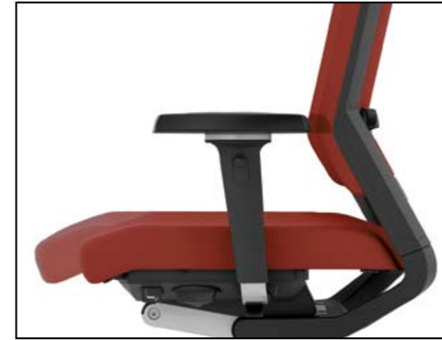
Sitztiefe / Seat depth / Profondeur d'assise / Zitdiepte verstelling

Integrated function | Fonctions intégrées | Geïntegreerde functies