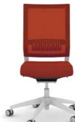
414.0200 + ls405-2