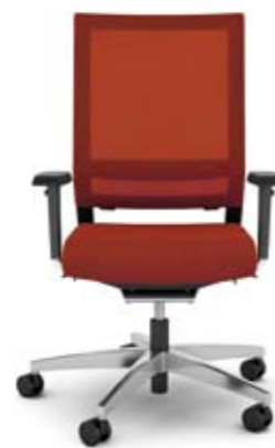
+ ls407 + al048