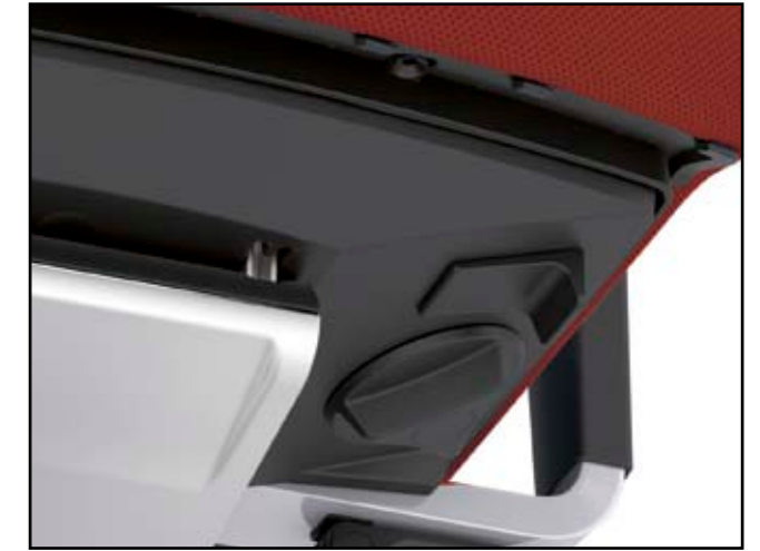
Federkrafteinstellung / Tension adjustment / Tension du dossier / Verstelling weerstand